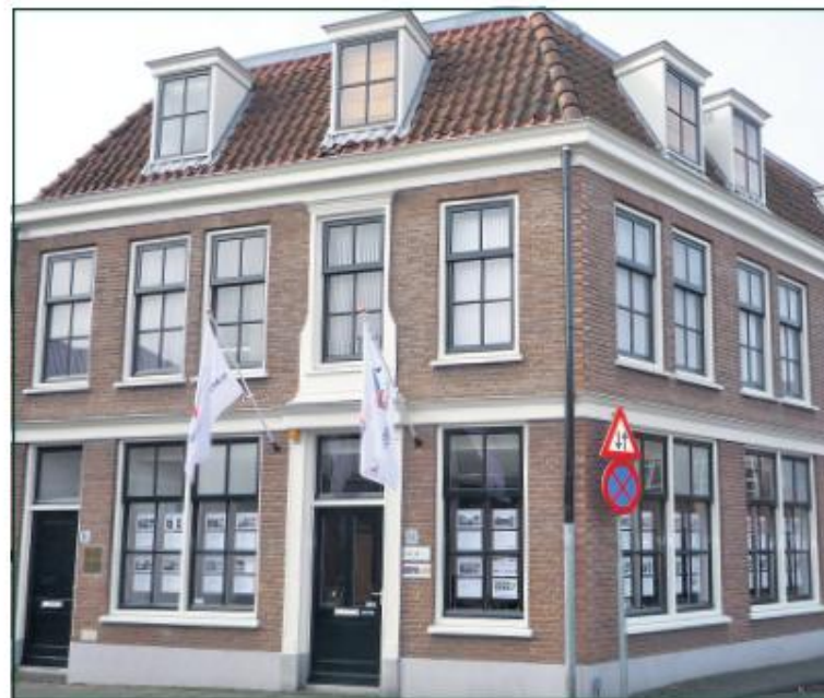
Makelaarscentrum Wassenaar is gevestigd op het vertrouwde adres aan de Kerkstraat 14.